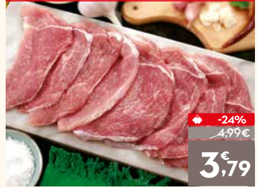
Filete de jamón de cerdo, el kg