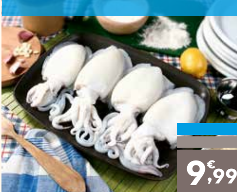
Sepia limpia el kg