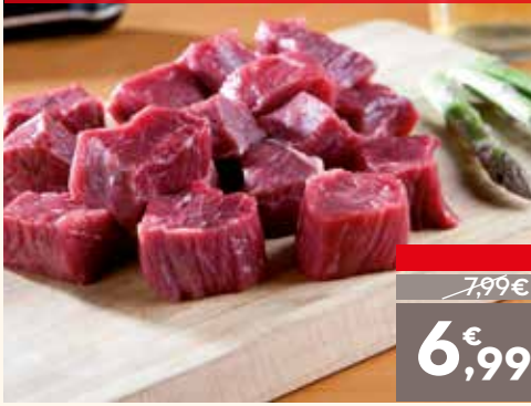
Aňojo para picar o guisar, el kg