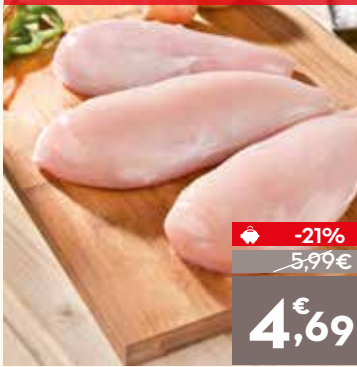
Pechuga de pollo, el kg