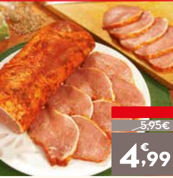
Lomo adobado extra tierno, el kg