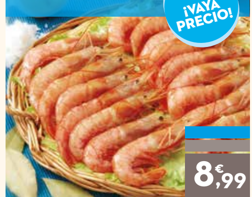
Gambón 20/30 piezas, el kg