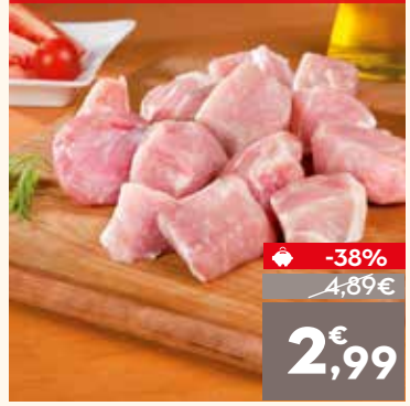
Estofado de cerdo, el kg