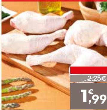
Traseros de pollo, el kg