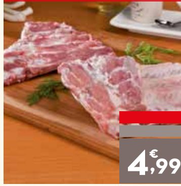
Costillas carnosas, el kg