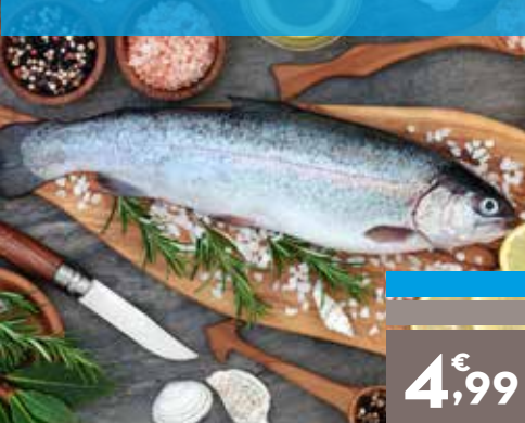
Trucha gorda, el kg