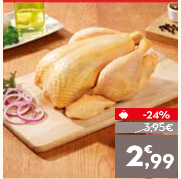
Pollo entero amarillo, el kg