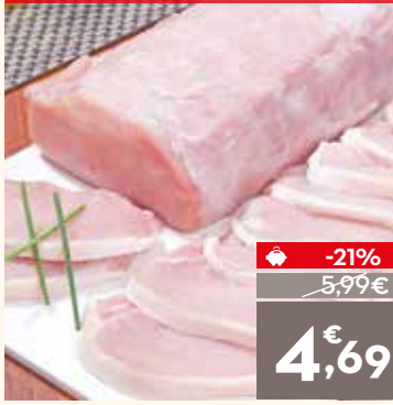
Cinta de lomo de cerdo, el kg