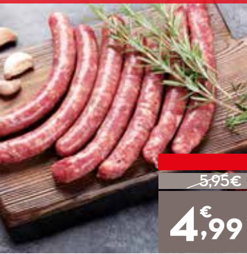
Salchichas blancas de cerdo, el kg