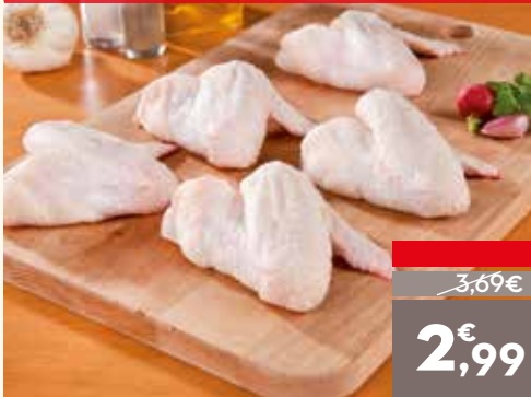
Alas de pollo, el kg