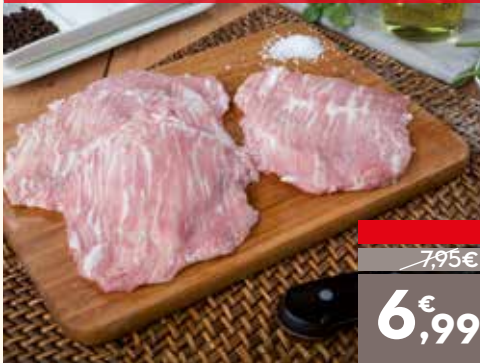
Secreto de cerdo ibérico, el kg