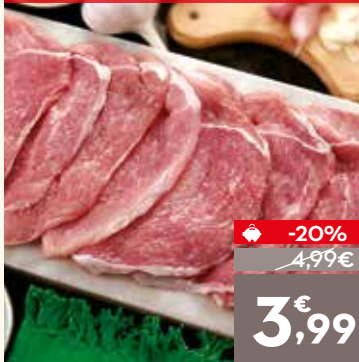
Filete de jamón de cerdo, el kg