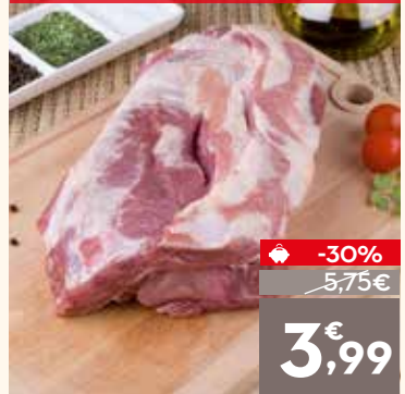
Cabeza de lomo de cerdo sin hueso, el kg