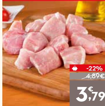
Estofado de cerdo, el kg