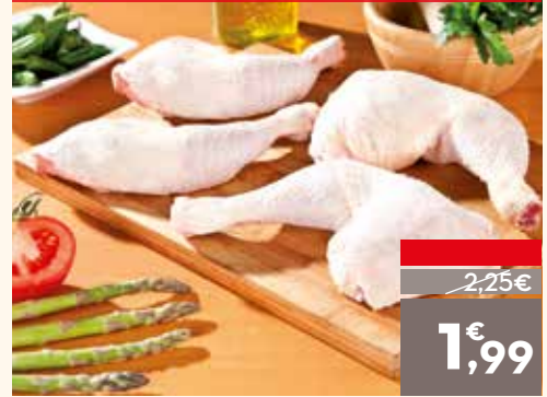
Traseros de pollo, el kg