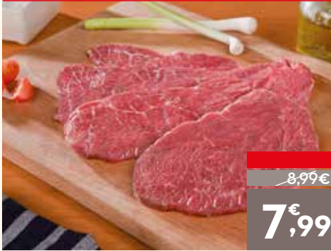
Filete de añojo 1ª B, el kg