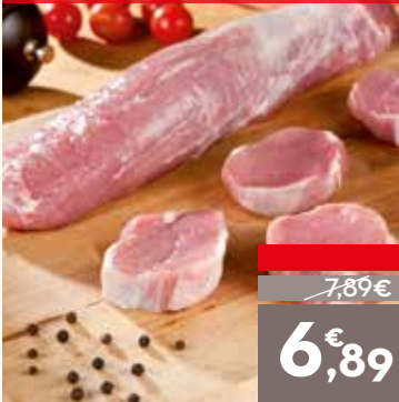
Solomillo de cerdo por pieza, el kg