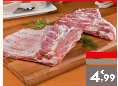
Costillas carnudas, el kg