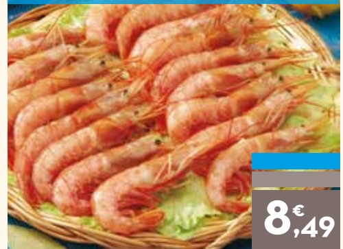
Gambón 20/30 piezas, el kg