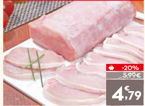
Cinta de lomo de cerdo, el kg