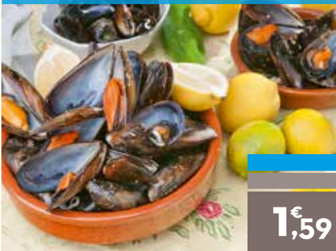
Mejill n, malla 1 kg aprox.