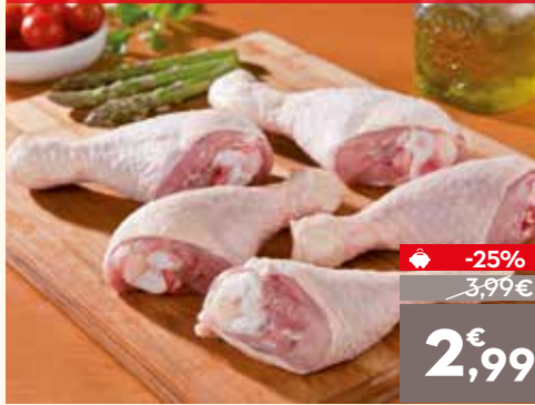
Jamoncitos o contramuslos de pollo, el kg