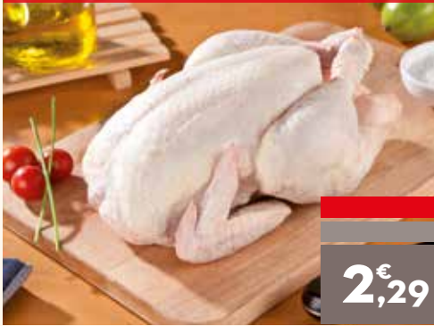
Pollo entero, el kg