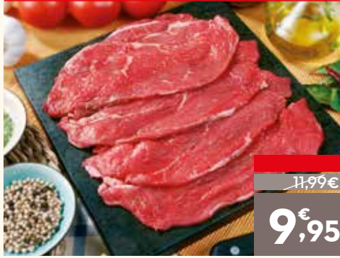
Filete de a ojo 1  A, el kg