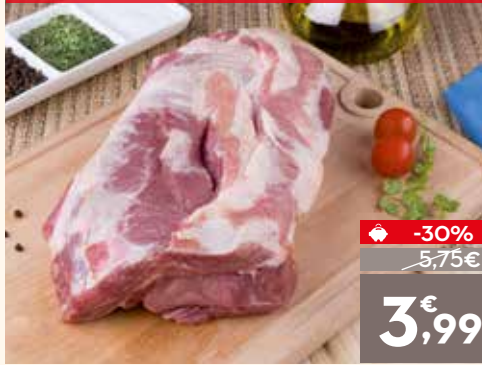
Cabeza de lomo de cerdo sin hueso, el kg