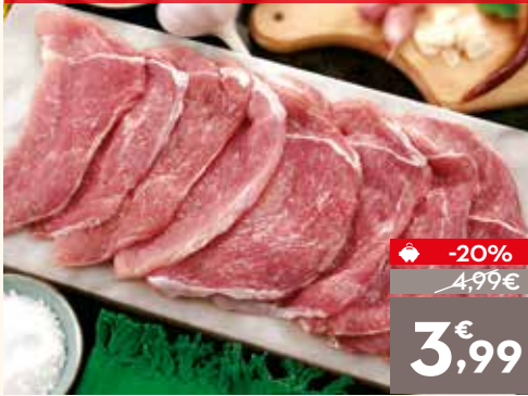
Filete de jam n de cerdo, el kg