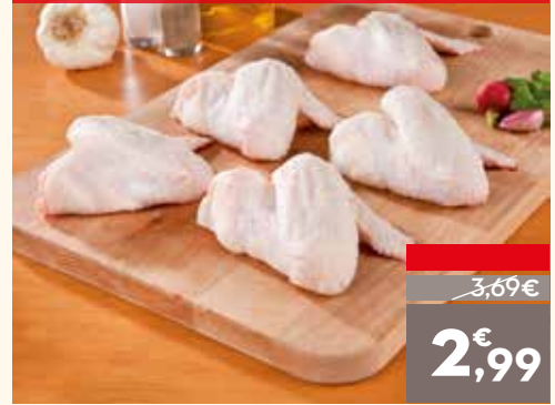
Alas de pollo, el kg