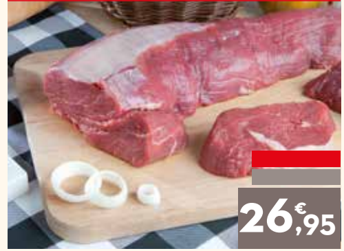
Solomillo de a ojo, el kg