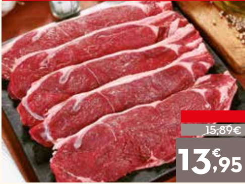
Entrecot de lomo de a ojo, el kg