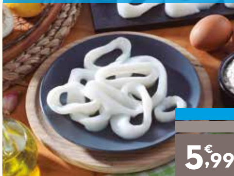
Anilla de pota, el kg